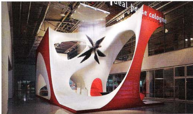
Außen knallrot, innen lackweiß. Wände und Möbel scheinen in Zaha Hadids „ideal house“ miteinander zu verschmelzen