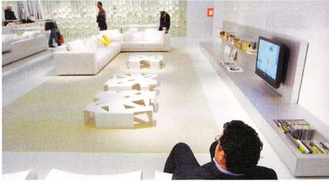
MDF Italia präsentiert seine Kollektion auf der Kölner Möbelmesse ausnahmslos in der Trendfarbe Weiß, in der Mitte der neue Beistelltisch Intersection